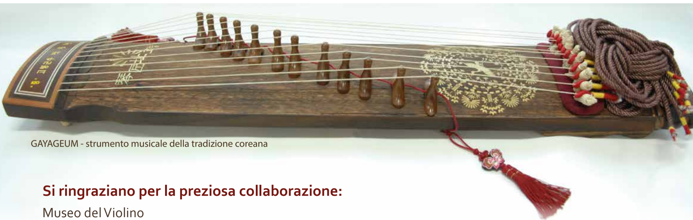
GAYAGEUM - strumento musicale della tradizione coreana

Si ringraziano per la preziosa collaborazione: