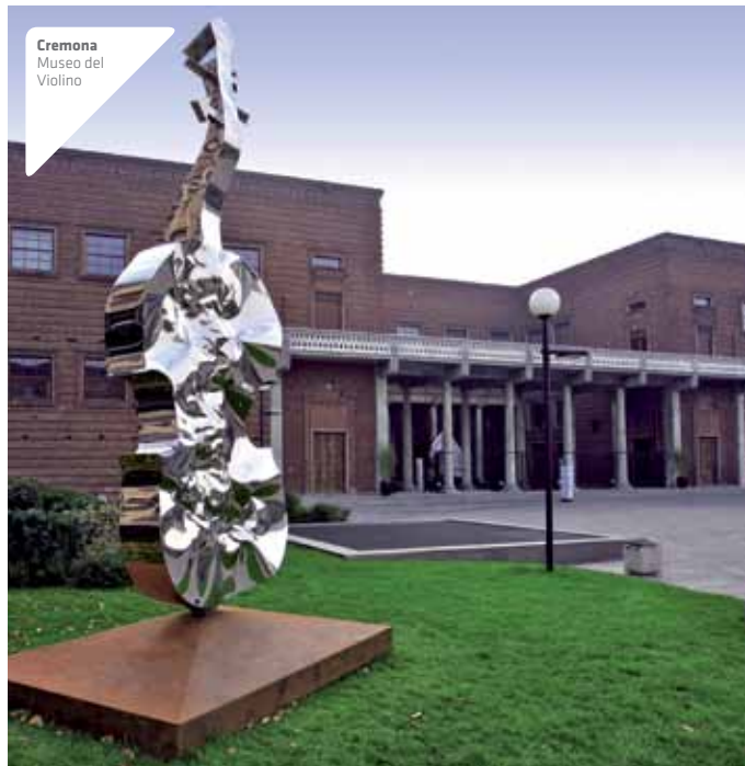
Cremona Museo del Violino

Piazza Marconi, 5 - Cremona +39 0372 801801, +39 0372 080809 (biglietteria) info@museodelviolino.org www.museodelviolino.org