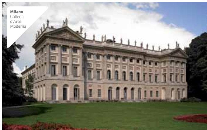
Milano Galleria d'Arte Moderna