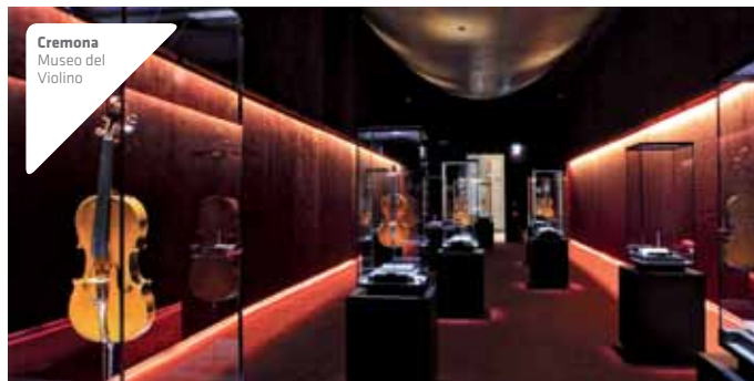
Cremona Museo del Violino