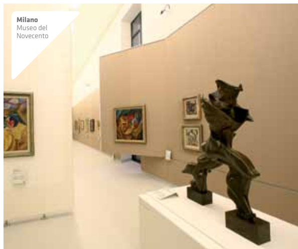
Milano Museo del Novecento