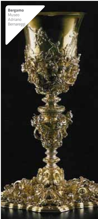
Bergamo Museo Adriano Bernareggi