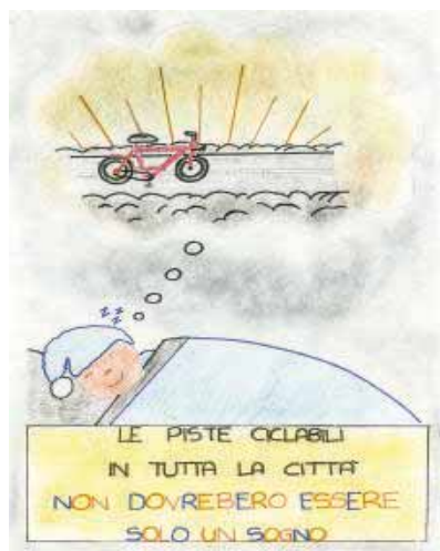
Gaia M. Piazza (III C - Beata Vergine - Cr)