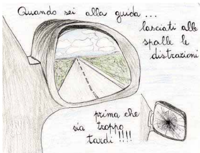
Ianne Thomas (III B - Media - Castelverde)