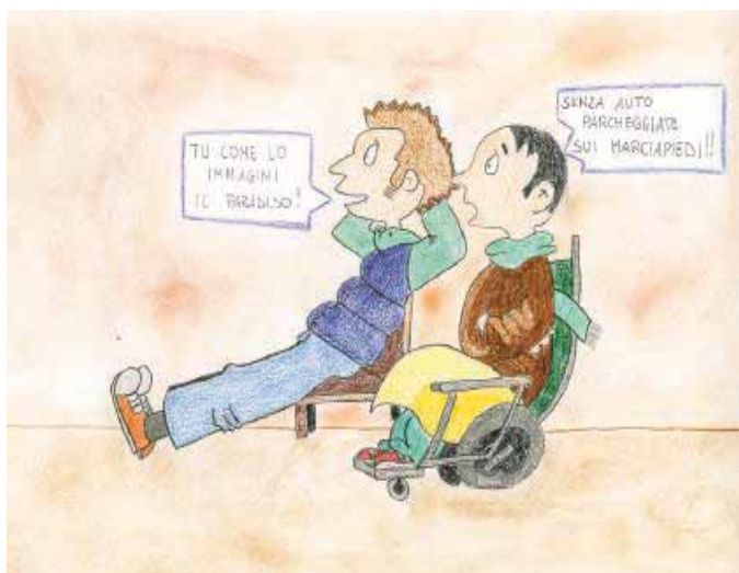
Emanuele Bonali (III A - Media Soncino)