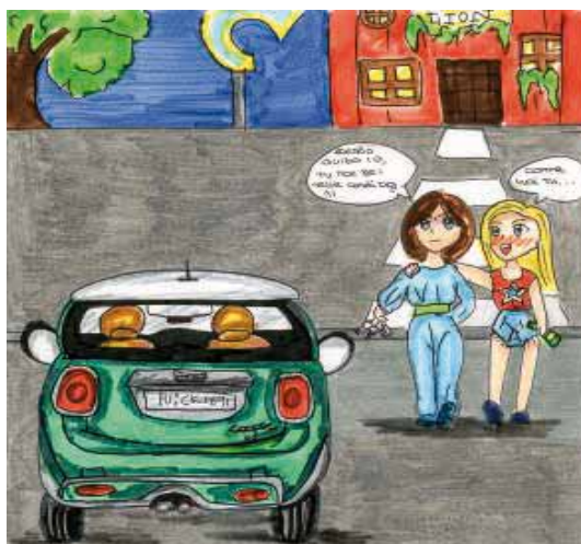
Sara Reali (III F - Diotti - Casalmaggiore)