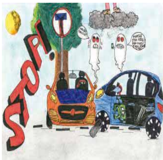
Davide Somenzi (III B - Sacchi - Piadena)