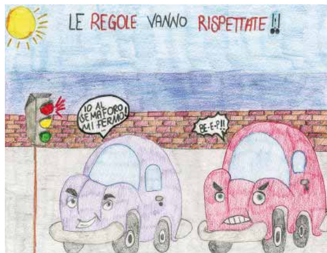
Alessandra Catalano (III B - Sacchi - Piadena)