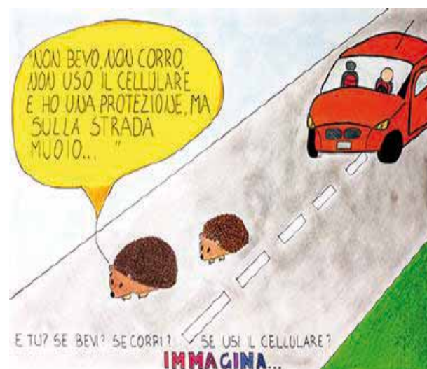
Penelope Saiani (III C - Bertesi - Soresina)