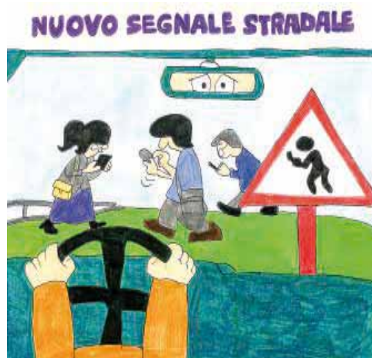
Giorgia Arfani (III A - Chiesa - Spino d'Adda)