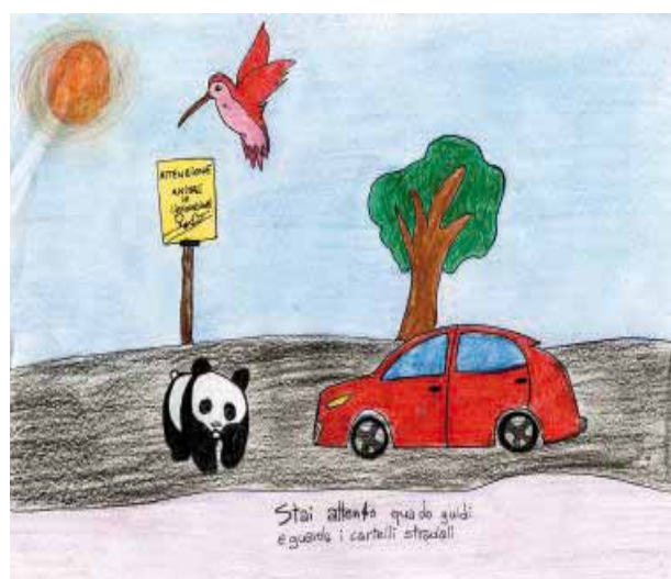
Giulia Questante (III A - Media Casalmorano)