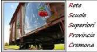
Scuola capofila IIS "J. Torriani" - Cremona