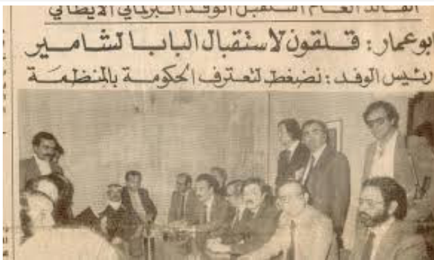
Beirut 5 marzo 1981- Yasser Arafat riceve nel suo bunker i membri della delegazione parlamentare italiana. A sin. di Arafat: Nemer Hammad e (fra gli altri) gli onn. Spataro, Borri, Gianni, Silvestri

Nota riassuntiva delle dichiarazioni rese al dott. Gentili della Procura della Repubblica di Bologna. (dal mio archivio)