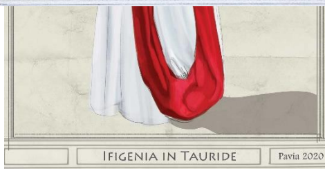
IFIGENIA IN TAURIDE

Coproduzione dei Teatri di OperaLombardia