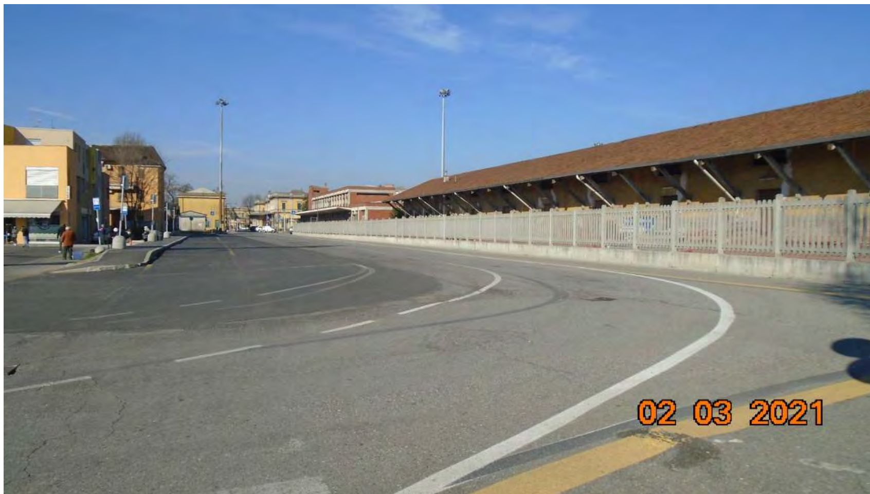
VIA DELLA VECCHIA DOGANA : Tratto terminale via Agli scali