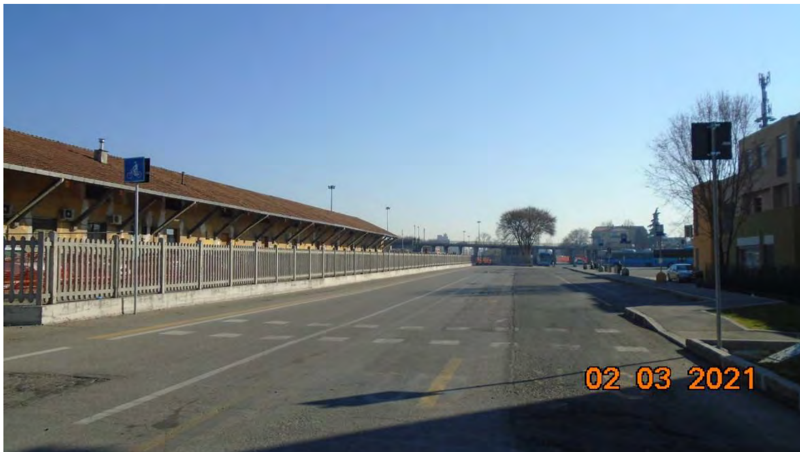
VIA DELLA VECCHIA DOGANA : Tratto terminale via Agli scali