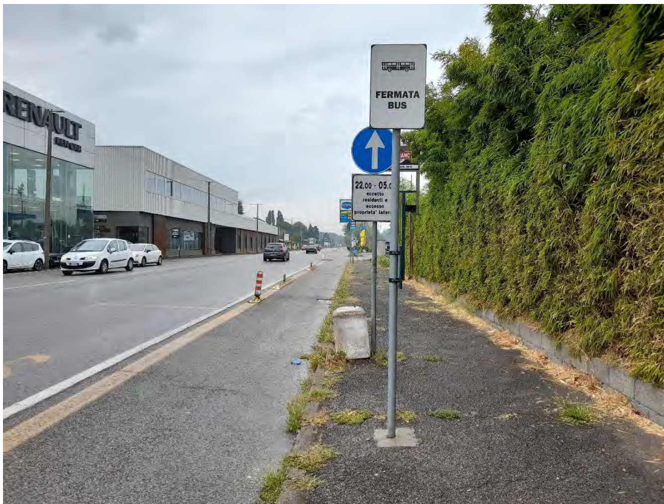
VIA MILANO : Tratto iniziale - Q.re Incrociatello