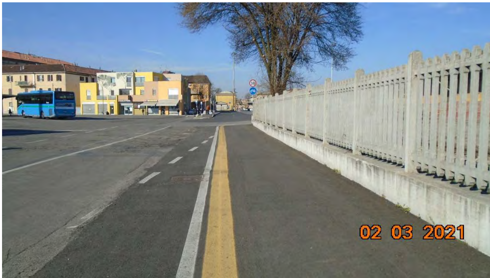
VIA DELLA VECCHIA DOGANA: Via Agli Scali