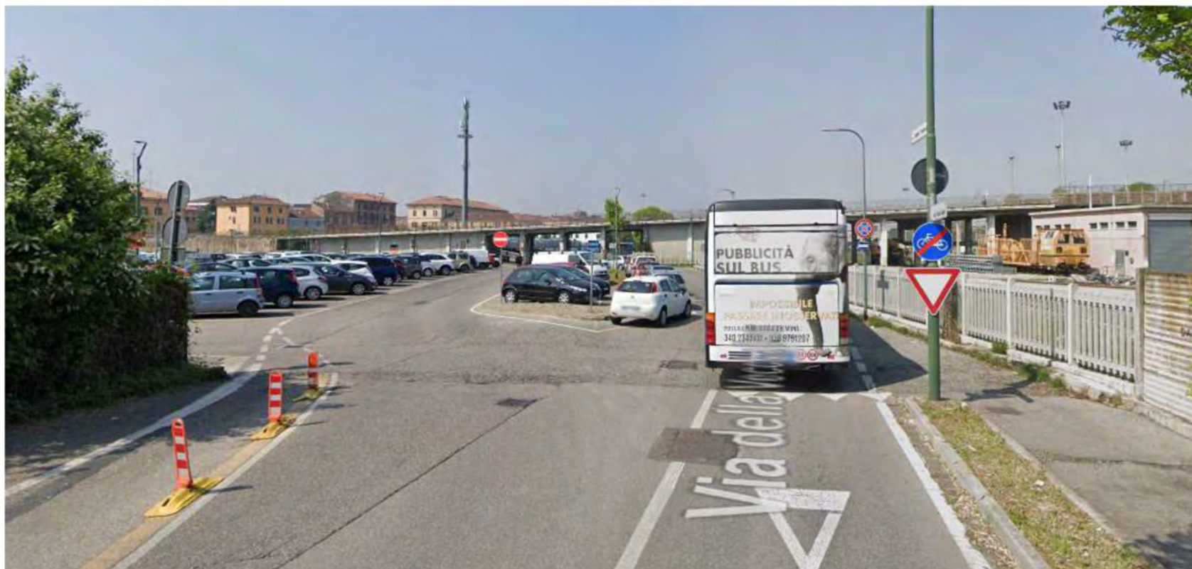
VIA DELLA VECCHIA DOGANA : Tratto iniziale di raccordo con pista ciclabile esistente via della Vecchia Dogana