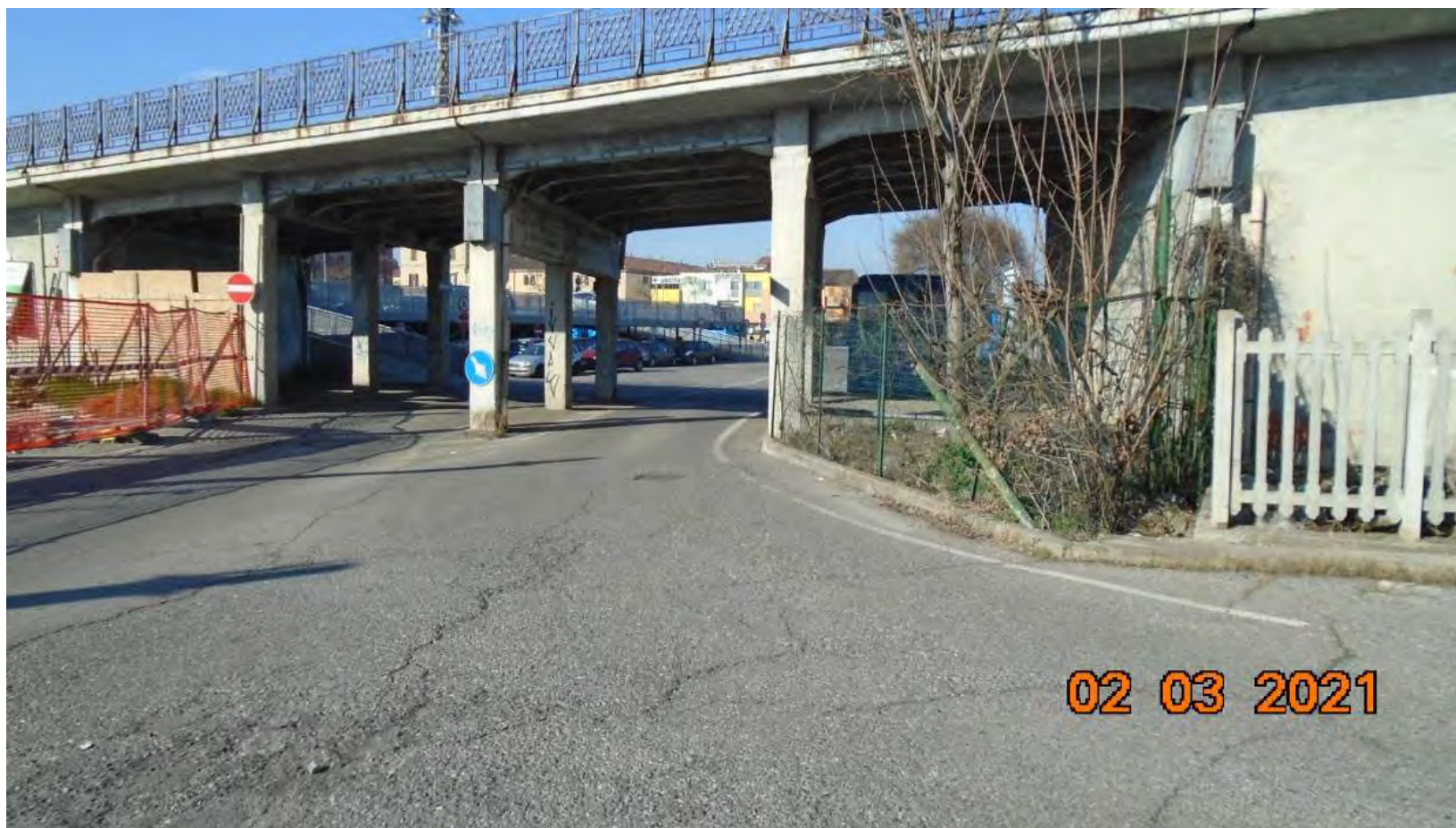
VIA DELLA VECCHIA DOGANA : Cavalcavia ferroviario via Cimitero