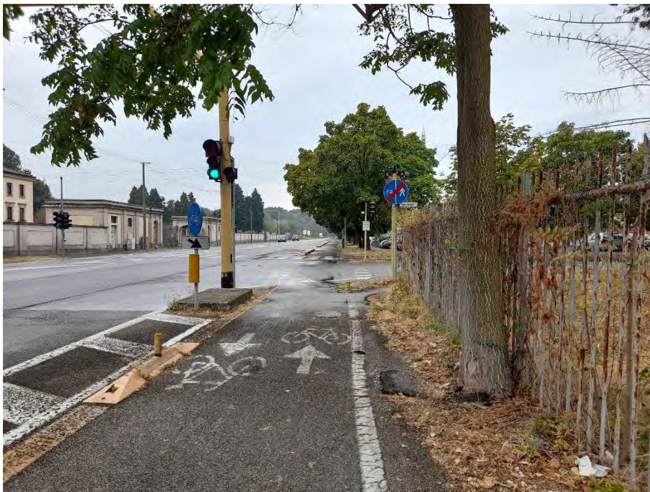
VIA MILANO : Tratto iniziale - Tratto terminale – intersezione via P. Corazzi