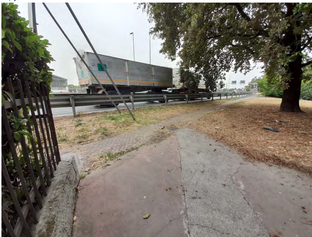
VIA SEMINARIO : Ingresso da via Pampurino

Rifacimento pavimentazione in autobloccanti tratto di percorso ciclo-pedonale compreso tra la pista ciclabile di via C.Acerbi e via Perugino, posto a nord di via Seminario.