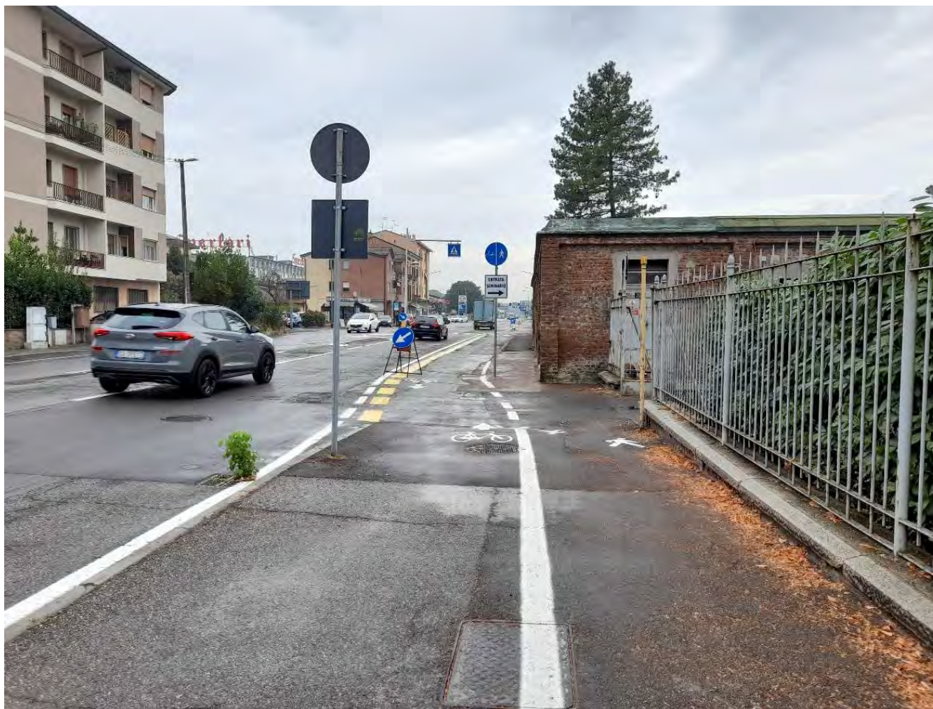
VIA MILANO : Tratto iniziale - Ingresso Seminario civico n.5/b