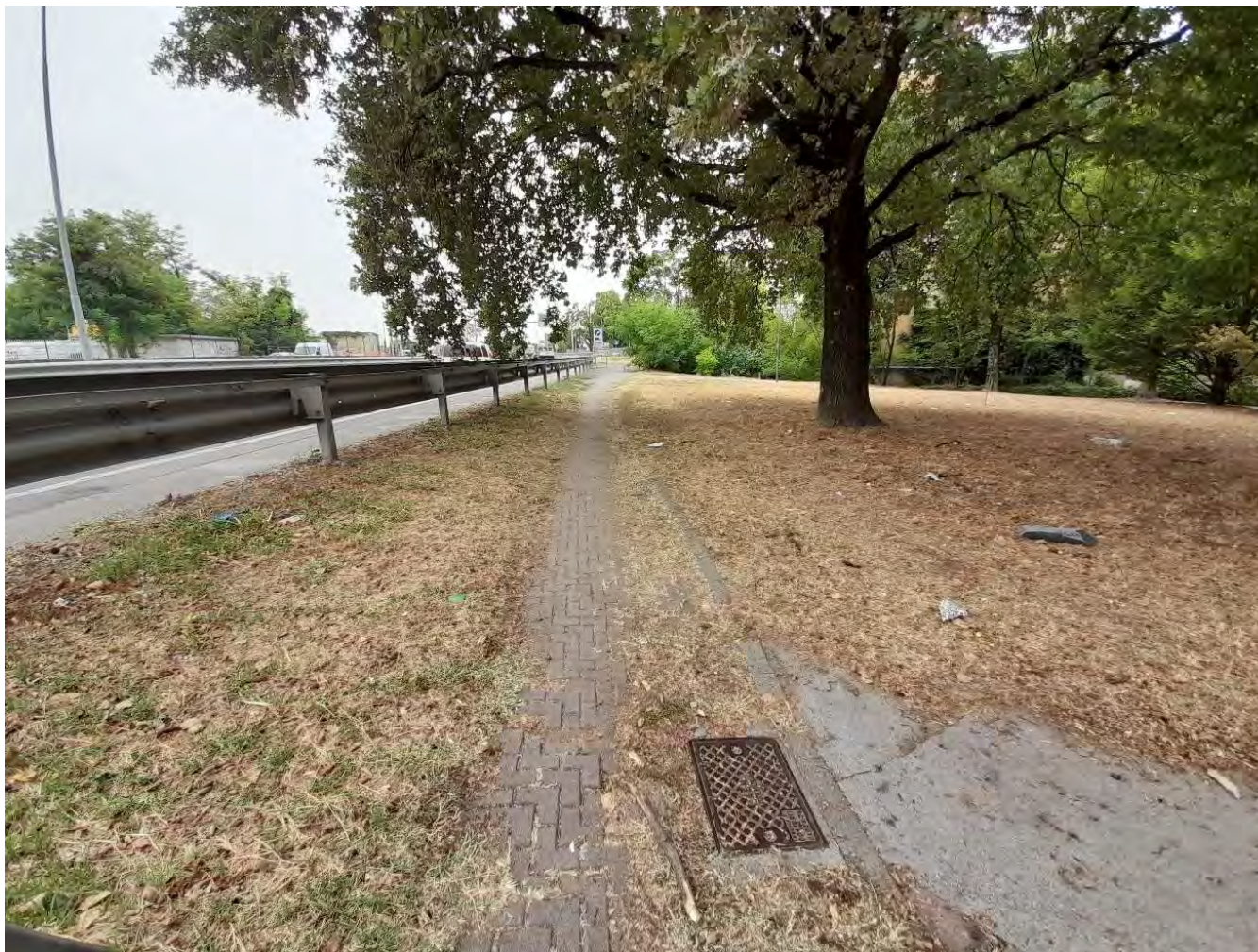
VIA SEMINARIO : Intersezione con via C.Acerbi (ciclo-pedonale)