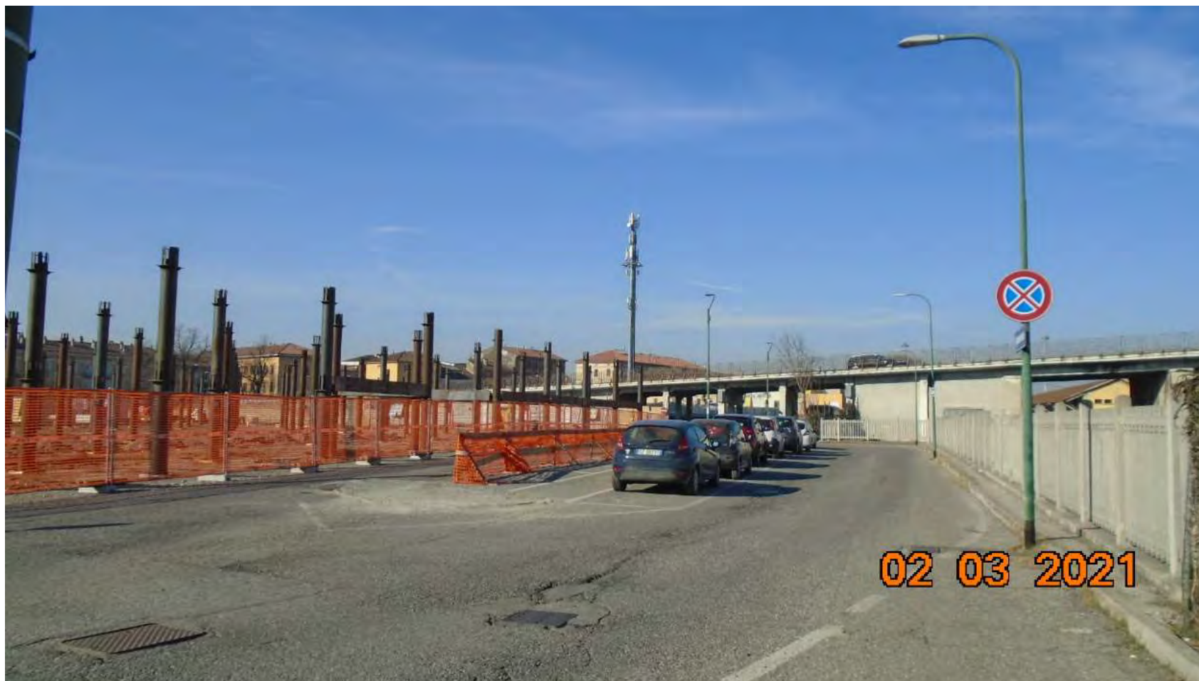
VIA DELLA VECCHIA DOGANA