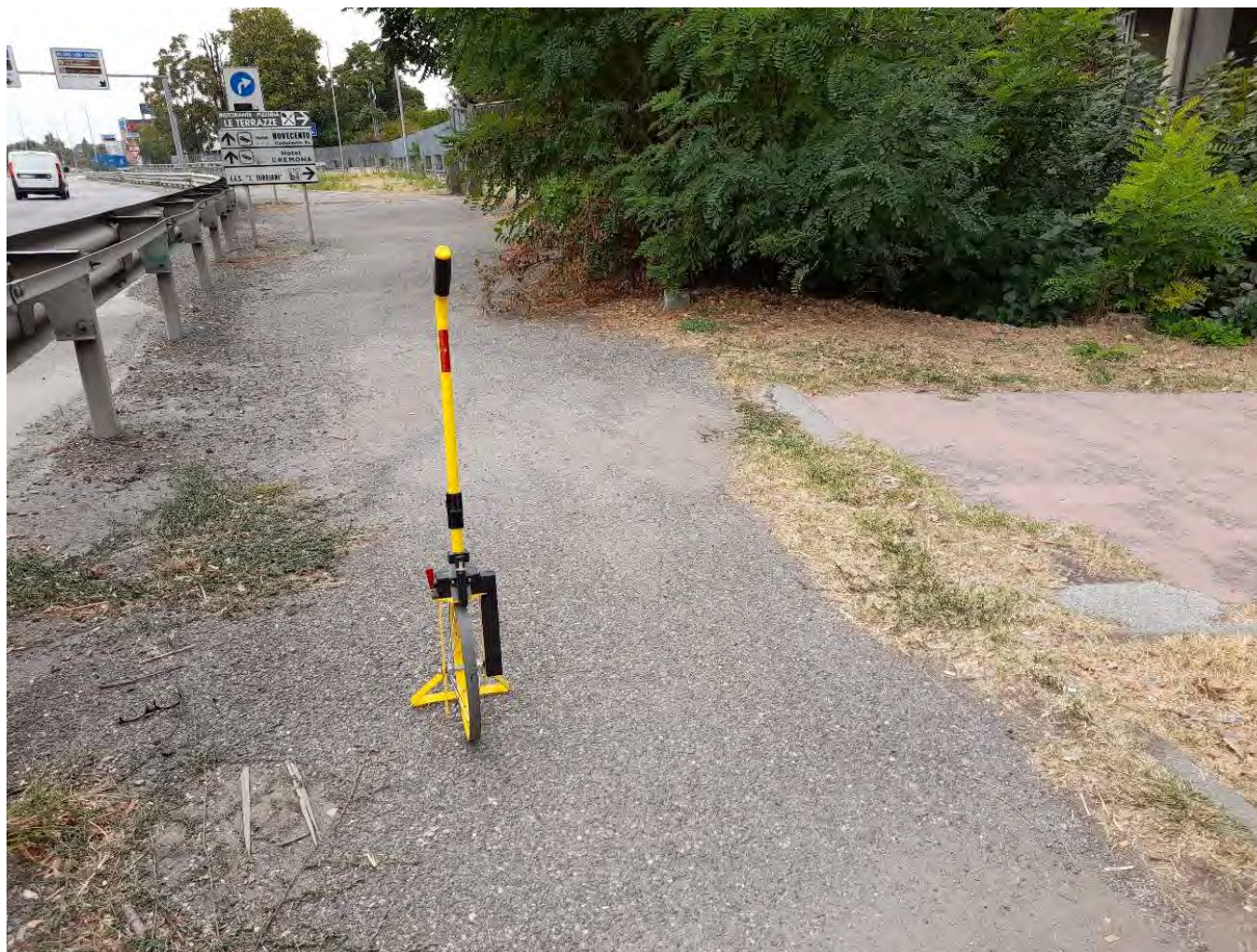
VIA SEMINARIO : Tratto terminale – accesso I.T.I.S.