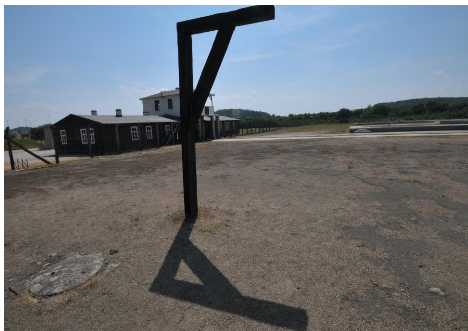
KL Gross Rosen (Polonia)

MARTEDI 23 NOVEMBRE 2021 - ORE 14:45 CREMONA - I.I.S. "TORRIANI" - AULA "VARALLI" SEMINARIO PER I DOCENTI