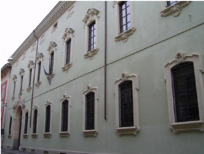
Facciata verso via Palestro