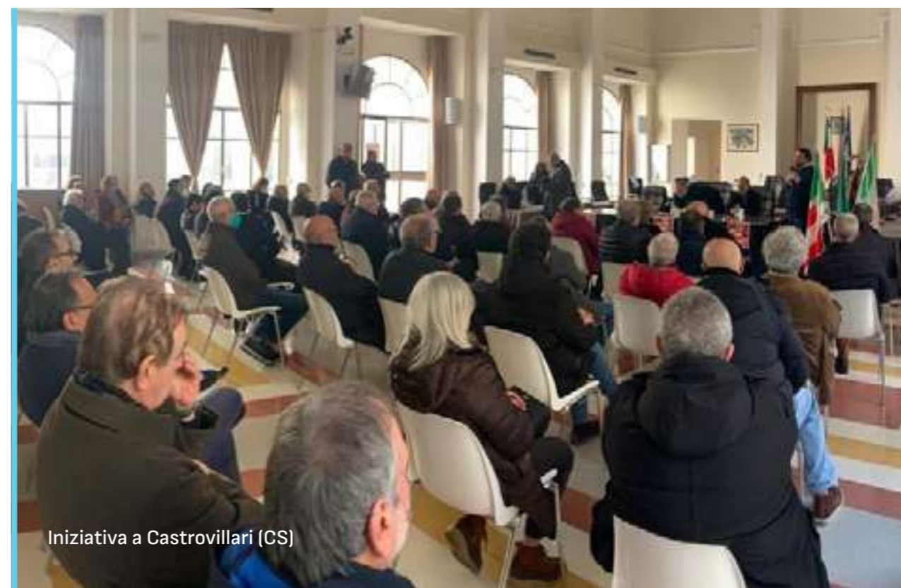
Iniziativa a Castrovillari (CS)