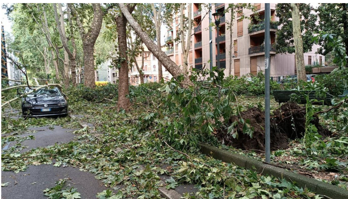
Milano, 25 luglio 2023

Legambiente: “I ristori non bastano più, bisogna prevenire, subito priorità alla crisi climatica. Città e territori devono ricevere più fondi per adattamento e mitigazione, serve una strategia più immediata ed efficace o presto i fondi per le emergenze diventeranno la norma”