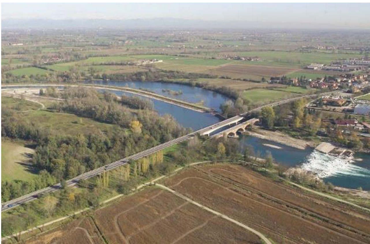
Tratto interessato dai lavori

La Provincia di Cremona spinge l’acceleratore, approva il linea tecnica il progetto definitivo con l’intento di avviare quanto prima i lavori di riqualificazione del tratto di Paullese nei comuni di Spino e Zelo Buon Persico della lunghezza di 1,5 Km. I lavori consistono nel raddoppio del sedime stradale e del ponte sull’Adda con il fine di aumentare la sicurezza e la fluidità del traffico esistente sull’arteria. E’ inoltre prevista la ristrutturazione del vicino ponte Asburgico, il quale verrà consolidato e destinato al transito dei mezzi agricoli e quale percorso ciclo-pedonale.