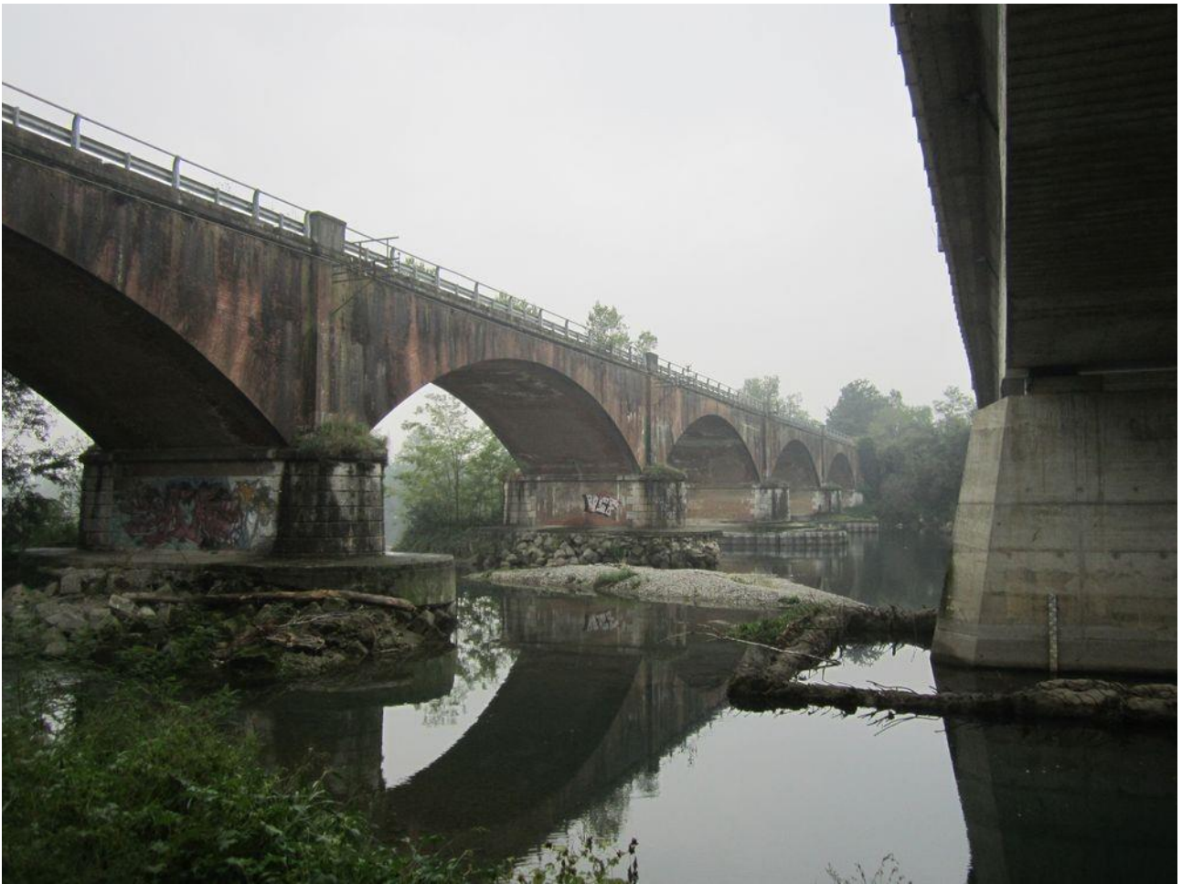
situazione attuale tra il ponte stradale della SP ex SS 415 e il ponte Asburgico