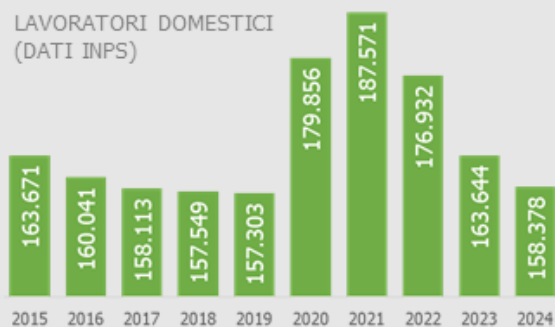
LAVORATORI DOMESTICI (DATI INPS)

30,1% Est Europa 20,3% Italia 21,6% Asia 21,1% America Latina 6,5% Africa 0,4% Altro